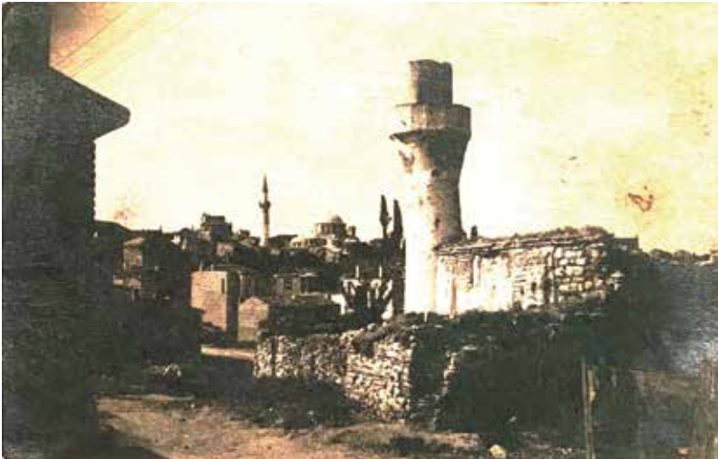
Resim 2. Encümen Arşivi'nde Odalar Mescidi, 20. yüzyılın ilk yarısına ait olan fotoğrafta arka planda görünen Kariye, yükselen ve artan yapılaşma dolayısıyla günümüzde görünmez.

Cumhuriyet döneminde eski eserlerin korunması ve bakımından sorumlu iki ana kurum Maarif Vekâleti bünyesinde yer alan Eski Eserler ve Müzeler Genel Müdürlüğü ile Vakıflar Genel Müdürlüğü'dür (Durukan, 2004: 37-38). Osmanlı döneminde kurulan Muhafaza-ı Asar-ı Atika (Eski Eserleri Koruma) Encümeni de erken dönemde sadece İstanbul ile sınırlı kalacak biçimde yeni idare tarafından tanınmıştır (Madran, 2002:210). Daha çok tespit ve koruma ihtiyaçlarının belirlenmesine odaklanan Encümen, 1941'e kadar toplam 797 eser tescil eder; tespit-