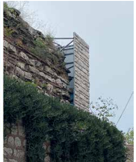
Resim 8. Ayvansaray Yenileme projesi kapsamında maskelenen Heraklius Suru (Mayıs 2023).