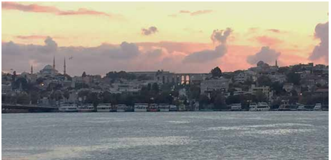
Resim 4. Haliç'ten Valens Kemerini ve çevresinin görünümü (2019).

Topkapı Sarayı Yerleşkesi ile yangın bölgesinin bir kısmının Prost planında arkeolojik park olarak düzenlenmesi önerilmiştir (Aykaç, 2021:338). Ancak Koruma Encümeni plan hazırlanırken görüşlerinin alınmaması ve çeşitli yanlışlar içerdiği gibi nedenlerle planın iptal edilmesi ve gerekiyorsa yeni plan hazırlanması yönünde görüş bildirir (Aykaç, 2021:348). Prost hipodromun da cumhuriyet meydanı olarak düzenlenmesini ve batısına adliye sarayı inşa edilmesini öngörmüştür (Özler, 2007: 85). Adalet Sarayına yer açmak için İbrahim Paşa Sarayı'nın mehterhâne kısmının yıktırılması ile beraber Alman Arkeoloji Enstitüsü'nden Alfons Maria Schneider Adliye Sarayı inşaat alanında kazılara başlar (Aykaç, 2021:346). Kazıda Azize Euphemia'nın kilisesi ve martyrion 'unun ortaya çıkması üzerine Whittimore kalıntıları taşımayı önermiş; ancak Ayasofya Müzesi Müdürü Ramazanoğlu'nun " devlet eliyle freskleri taşımak ve diğer kalıntıları yok etmekle İstanbul'da ne Bizans ne de Türk eserlerinin korunmasının mümkün olmayacağını " belirten tavrı ile kalıntılar taşınmamıştır (Aykaç, 2021:350). Buna ilaveten yine alanda gerçekleştirilen İstanbul Arkeoloji Müzeleri Müdürü Rüstem Duyuran başkanlığındaki kazıda ise geç antik döneme tarihlendirilen Antiokhos ve Lausos Saraylarına ait kalıntılar ile Hipodrom'un basamakları ortaya çıkar (Resim 5). Kalıntılara rağmen Adliye Sarayının Sultanahmet'te inşa edilmesi yönünde alınan Bakanlar Kurulu kararının ardından proje