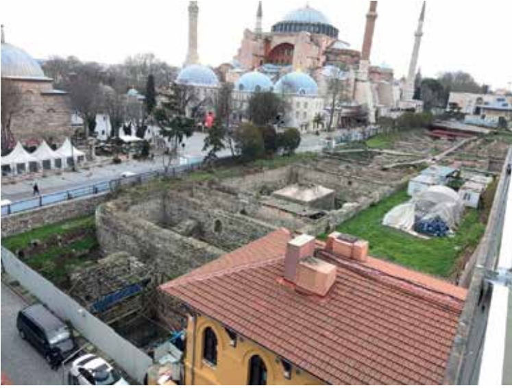
Resim 7. Sultanahmet, Ayasofya'nın güneyinde Büyük Saray kalıntıları (2020).

Korunması ve Yaşatılarak Kullanılması"na ilişkin 5366 sayılı kanundur; "Yenileme Kanunu" birçok tarihi alanın dönüştürülmesinde kilit rol oynar (Esmer vd, 2023). Bu yasa ile Bakanlar Kurulu, "kentsel yenileme alanları" belirleyebilirken, geleneksel planlama sisteminin aksine yerel yönetimlere (belediyelere) bu alanlar üzerinde büyük yetki vermektedir. Tarihi Yarımada içinde belirlenen Sulukule, Ayvansaray, Süleymaniye gibi yenileme alanları koruma disiplini açısından olumsuz örnekler olarak tartışılmaktadır (Resim 8-10).