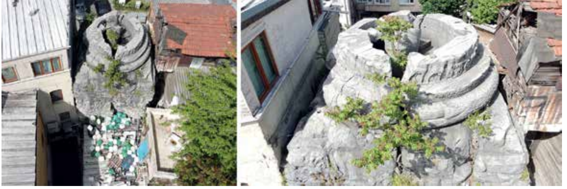
Resim 11. Arcadius Sütunu güncel durumu (İsmail Enes Doğan, Mayıs 2023).