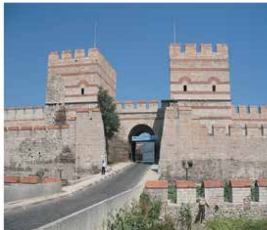
Resim 6. İstanbul Kara Surları, Belgrad Kapı, 19. Yüzyıl sonunda Sebah-Joallier fotoğrafında ve pilot proje uygulaması sonrası 1990’larda görülmektedir.