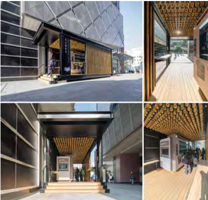
Şekil 4. Kütüphane İstasyonu (Shuang, 2019).

Bir yüksek lisans araştırmasında, Singapur ve Taipei'deki sokak satıcılarının, kendileri için oluşturdukları iç mekân tasarım teknikleri analiz edilmiştir. Sokak ajanları olarak nitelendirilen satıcılar, çevre koşullarına uyum sağlamak için değişken ve uyarlanabilir tasarımlar yapar. Fırsata bağlı bu uygulamalar, duraklama, davet etme, mobil olma ve dönüştürme gibi taktikler içerir. Zaman ve mekânın farklı durumlarına yönelik doğaçlama tepkiler , toplanma ve düzenleme işleri, iç mekânı çeşitlendirir. Sokak satıcıları; kent mekânında birleştirici, sürdürülebilir, geçici, hareketli ürünleriyle kentsel iç mekânlar üretir (Şekil 5) (Attiwill, 2011b).