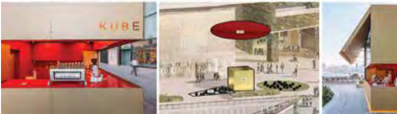
Şekil 8. The Kube Installation (Pintos, 2019).