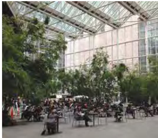
Şekil 1. Kentsel İç Mekân Keşif Projesi, Berlin (Hinkel, 2011).

Kent Odası (Urban Room, 2009), kentsel iç mekânın uygulama ve teknikler açısından potansiyelini düşünmek için geliştirilen iç mimarlık proje stüdyosudur. İki aşamada yürütülen stüdyonun ilk aşamasında, kentte; kentsel iç mekânların, nasıl yer bulacağına odaklanılmıştır. Kentin mevcut dokusu 'kalıp' gibi düşünülerek, bu kalıbın etrafında şekillenecek yeni mekânlar ve etki eden faktörler ele alınmıştır. Stüdyonun ikinci bölümünde, araştırmalardan yola çıkarak Melbourne kenti için 'kent odası' tasarımları geliştirilmiştir. Kent Odası kapsamında, kentte