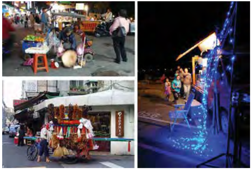
Şekil 5. Singapur Taipei'de sokak satıcıları (Attiwill, 2011b).

Kentsel iç mekân pratiğinin kentteki konumu, yani bağlamı en belirleyici stratejidir. Kentsel iç mekân tasarım pratiklerine baktığımızda; 'meydan, cadde, sokak gibi geleneksel kamusal alanlarda', 'alışveriş merkezi, plaza, kütüphane gibi yarı kamusal alanlarda', 'kente eklenen' ve 'bir yere ait olmayan, kentte hareket halinde olan' olmak üzere dört farklı bağlamda tasarlan-