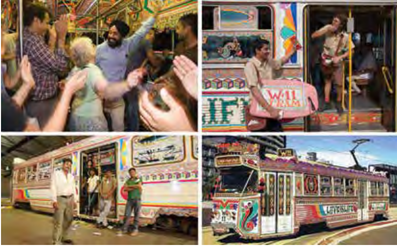
Şekil 7. W-11 Treni (Douglas, 2011).

Kentsel iç mekânların en belirgin özelliği geçiciliktir. Pratikteki karşılığına baktığımızda, geçiciliği, bir etkinlik çerçevesinde tasarlandysa onun süresine, kullanıma ve kullanıcıya bağlı olduğu görülmektedir. Geçicilik, kent yaşamı içinde belirlenmekte, zaman mekân dönüşümünü, kullanıcı değiştirmektedir. Kentsel iç mekânların geçicilik özelliği ile statik kent