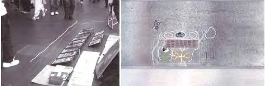
Şekil 3. Kent Odası kapsamında sokak satıcısı (Attiwill, 2011a)

gözlemlenen durumlardan bir tanesi fotoğraf satan sokak satıcısının kendi sınırlarını zemine çizerek, mekânsallaştırmasıdır (Şekil 3). Satıcının, kendi mekânını belirtme isteği; kullandığı alanı sahiplenmesi, işi için tanımlanmış bir yere ihtiyaç duymasından kaynaklanmaktadır. Kentin farklı yerlerine konumlandığı satış standı ve yere yaptığı çizim ile hem alıcılar tarafından kullanımına sınırlama getirmekte, hem de bulunduğu mekân ile işini özdeşleştirmektedir (Attiwill, 2011b).