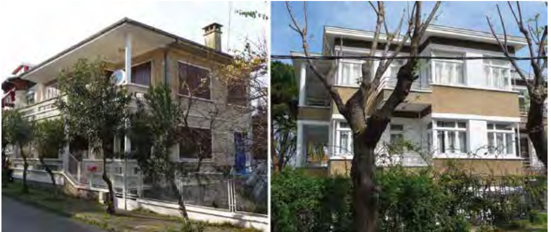
Resim 9. a. Aydoğdu Sokak, Büyükkada. b. Çarkifelek Caddesi ve Yaverbey Sokak köşesi, Büyükkada.