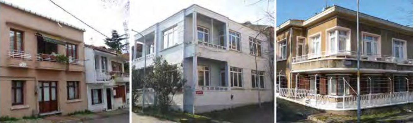
Resim 8. a. Aydoğdu Sokak, Büyükkada. b. Alpaslan Sokak, Büyükkada. c. Alpaslan Sokak, Büyükkada.