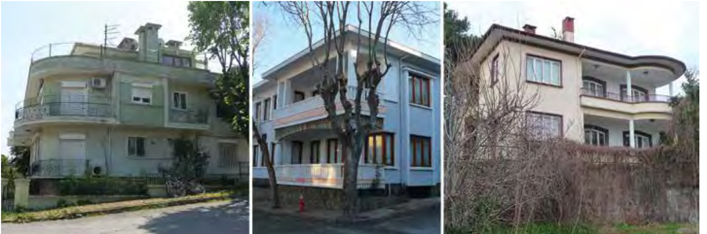
Resim 13. a. Panjur Sokak - Kesedar Sokak köşesi, Büyükkada. b. Zağnospaşa Caddesi - Topuz Sokak köşesi, Büyükkada. c. Malül Gazi Caddesi, Büyükkada.

1940 ve 1950'lerin Arkitekt dergilerindeki örneklerden Emin Necip Uzman'ın 1946'da yayımlanan Büyükkada'daki projesinde 7 kırma çatılı, cephesinde taş kaplama ve mozaik kullanılan, şöminenin dışarıdan okunduğu, kemer ve basık kemer gibi modernist tutuma yabancı öğelere hem cephede hem de iç mekânlarda rastladığımız bir mimari görmekteyiz. 1948'de Büyükkada'da yine aynı mimara ait bir yapı 8 , 19. yüzyıl köşklarinin azametini öykünen, geniş