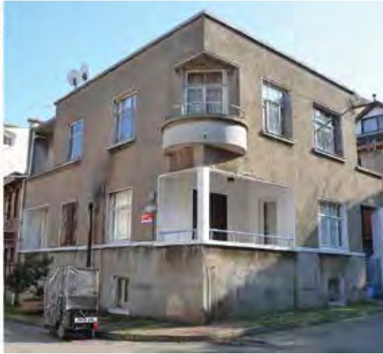
Resim 6. Büyükada örnekleri: a. Nevruz Sokak. b. Topuz ve Panjur Sokak köşesi. 5

yıcı sistemler çağdaş taşıyıcı sistemlerin yanında yer alacaktır. Hatta Büyükada Alpaslan sokakta taşıyıcı sistemde geleneği takip eden, tek katlı ve ahşap taşıyıcılı bir art deco konut örneği de mevcuttur. (Resim 3)