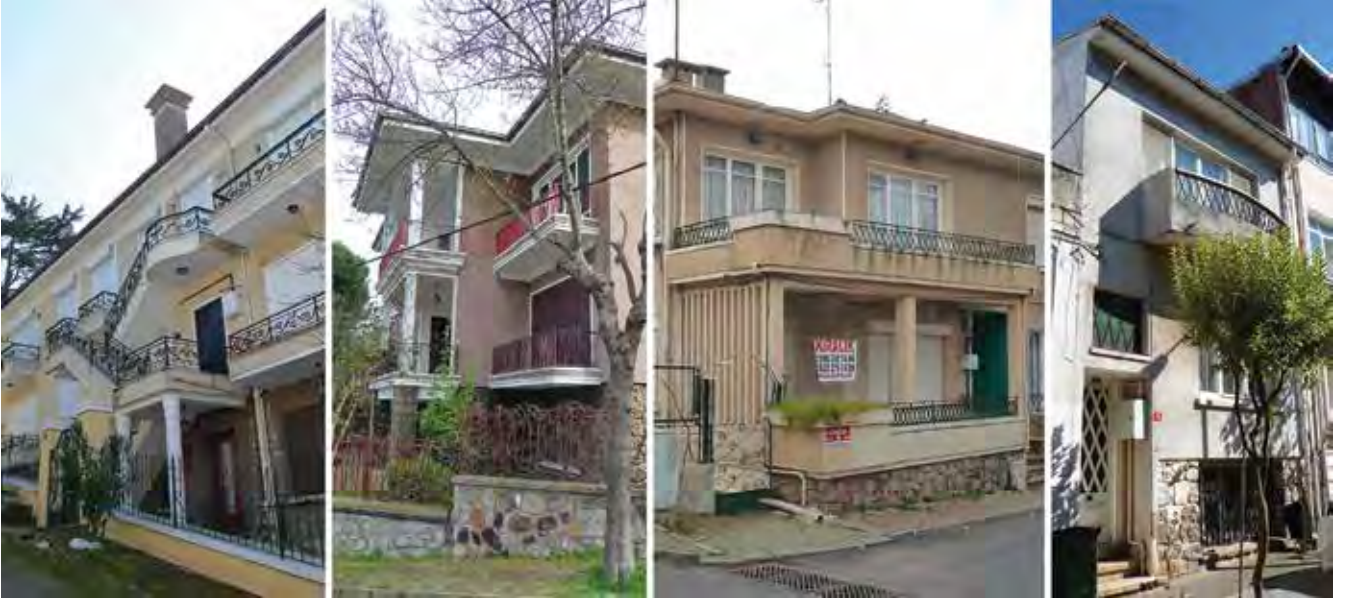
Resim 12. a. Çankaya Caddesi - Conpaşa Yokuşu köşesi, Büyükkada. b. Çarkifelek Caddesi - Misak Sokak köşesi, Büyükkada. c. Lala Hatun Caddesi - Aydoğdu Sokak köşesi, Büyükkada. d. Fenerbahçeli Letter Sokak, Büyükkada.

Taş kaplama bodrum katı cephesi, doğramalardaki eşkenar dörtgen motifler ve yine dönemin simgesi olan kesik elips balkon alniyla Resim 12'deki örnek, geç 1940'lar, erken 1950'ler klasisizmine örnektir. Bu özelliklere ek, mozaik kaplamalı giriş katı, cephede dik açısız geometrik bölünme, parapet seviyesinde geleneksel ahşap kaplamaya gönderme yapan renkli mozaik yatay elemanlar, tuğla söveli basık kemerli pencereler de izlenir. Panjur Sokak köşesindeki konutta ise, birinci kat cephesinde geometrik bölünme, balkon korkuluğunun şeffaflaşması, korkuluğun demir kısmında 1940'ların işçiliği, kâgir kısımlarında 1950'ler mimarlığına dair yuvarlak delikler kullanılmasıyla hafifletici etki yaratılmıştır. Zağnospaşa Caddesi - Topuz Sokak köşesindeki yapı, cephede iki tür mozaik, taş kaplamalı subasmanı, birinci kat balkonunda taş kaplama basık kemeri ve taşıyıcısı, Mısır uygarlığını anımsatan stilize edilmiş betonarme kolonlarıyla; Malül Gazi Caddesi'ndeki ise tuğla söveli basık kemerli pencereleriyle 1940'lar ve 1950'ler klasisizmini örneklemektedir. (Resim 13)