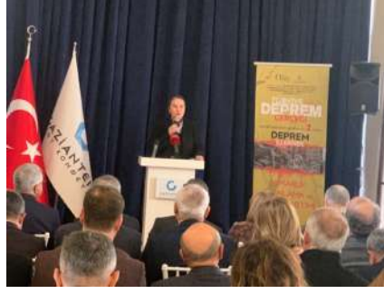
Resim 2. Afet ve Mimarlık Arama Konferansı açılış konuşması.