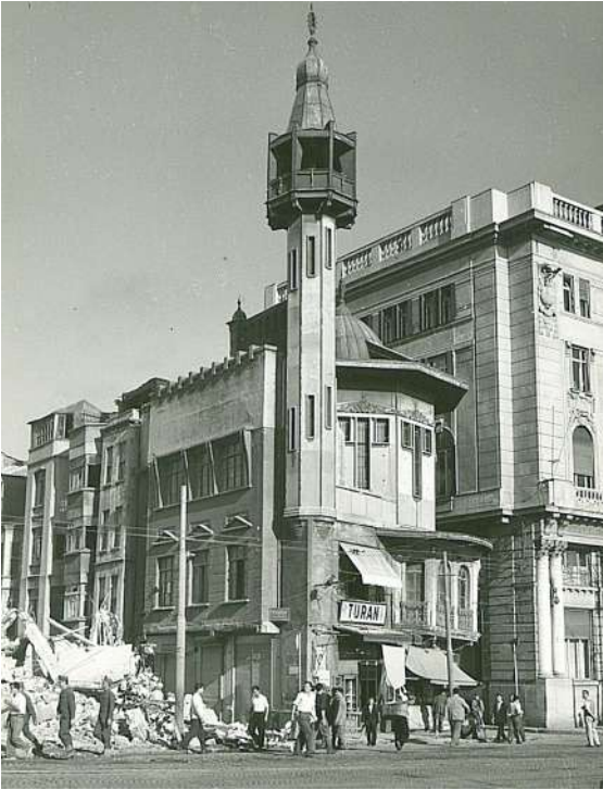
Resim 2. 1958 Yıkımlarından önce Merzifonlu Kara Mustafa Paşa Mescidi.

Bu basın açıklaması 20 Kasım 2024 tarihinde kamuoyuyla paylaşıldığı üzere 1958 yılında yıkılan Raimondo d'Aronco tasarımı Merzifonlu Kara Mustafa Paşa (Karaköy) Mescidi'nin İBB Miras (Kültür Varlıkları Dairesi Başkanlığı) tarafından yeniden yapılacağına duyurulması üzerine konu hakkında TMMOB Mimarlar Odası İstanbul Büyükşehir Şubesi'nin ilkesel görüşlerini açıklamak üzere hazırlanmıştır.