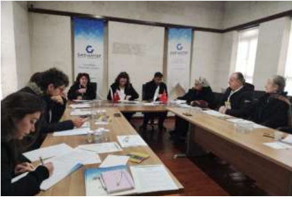
Resim 3. Afet ve Mimarlık Arama Konferansı çalışma grup toplantısı.