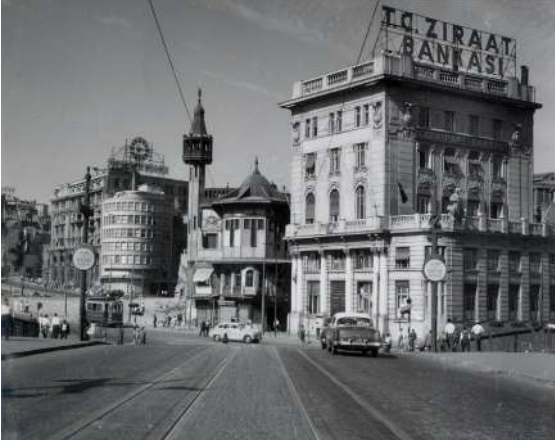
Resim 1. 1958 Yıkımlarından önce Karaköy Meydanı'ndan bir görünüm.