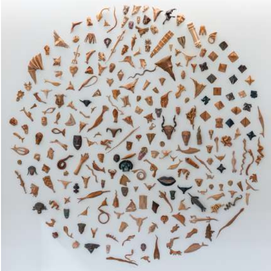
Sergi Tanıtım Bülteninden.

izleyici tarafından hareket ettirilebilen ve kendi içerisinde dengesi olan soyut formlar üzerinde çalışmaya başladı. Sanatçının Devinim ve Denge başlıklı retrospektif sergisi, 2012'de İş Sanat Kibele Sanat Galerisi'nde gerçekleşti. Arış'ın denge kavramına yoğunlaştığı yapıtlarını, ses