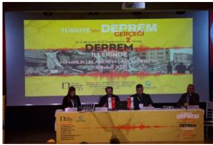
Resim 6. Afet ve Mimarlık Sempozyumu II. oturum.

Meclisi Başkanı Aslı Ölçal Tezel'in açılış konuşmalarını yaptı. TMMOB Mimarlar Odası Yönetim Kurulu Başkanı Zeynep Eres Özdoğan, depremin ardından "Mimarlar Odası olarak, teknik incelemeler yaptıklarını, depremin neden bu kadar büyük bir yıkıma yol açtığını sorguladıklarını ve gelecekte benzer felaketleri yaşanmaması için neler yapılması gerektiğini tartıştıklarını" dile getirdi. Depremin ikinci yılında,