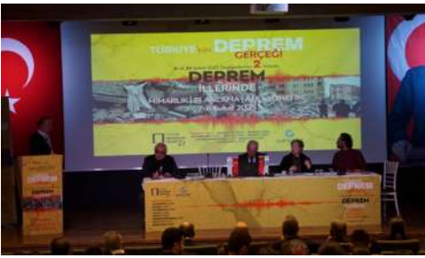
Resim 5. Afet ve Mimarlık Sempozyumu I. oturum.