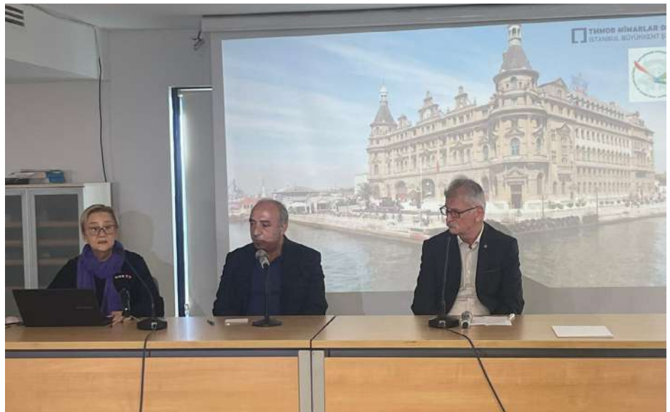
Haydarpaşa Dayanışması basın açıklamasından.