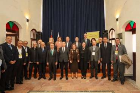
Resim 1. Afet ve Mimarlık Arama Konferansı açılış (Fotoğraf: Filiz Ayaz).