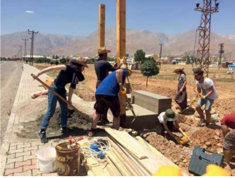
Resim 8. Plankton Project DURAKovacak projesi yapım aşaması, 2015.

2000'li yıllarda Türkiye'de mekân siyasetinde mücadele kavramı, mega projeler ve kentsel dönüşüm karşıtı mücadelelerden çevre mücadelelerine kadar farklı alanlarda karşımıza çıkmaktadır. Mücadele kavramı Dayanışmacı Atölye, Düzce Umut Atölyesi, Başka Bir Atölye ve Mimar Meclisi'nin sözcük dağarcığında doğrudan yer alırken, Herkes için Mimarlık Derneği ve Plankton Project, kavramla sınırlı ve/veya dolaylı ilişki kurmaktadır. Öte yandan mücadelenin anlamı gruplar için iki yönlüdür. Bu yönlerden ilki, mimarlık ve planlamanın araçlarıyla kentsel muhalefet aktörlerini güçlendirmeye dönüktür. İkincisi ise mimarlık ve planlama mesleklerinin mevcut pratiklerine dönük eleştirilerle şekillenen, üniversiteler ve meslek odaları da dahil olmak üzere, kurumlar eliyle üretilen formal mimar-