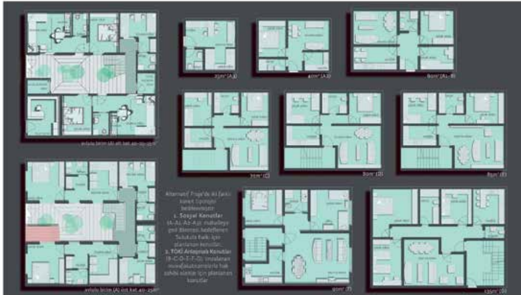
Resim 3. Dayanımcı Atölye'nin de içinde yer aldığı Sulukule Atölyesi tarafından hazırlanan Sulukule Alternatif Projesi'nden örnek (sulukuleatolyesi.blogspot.com).